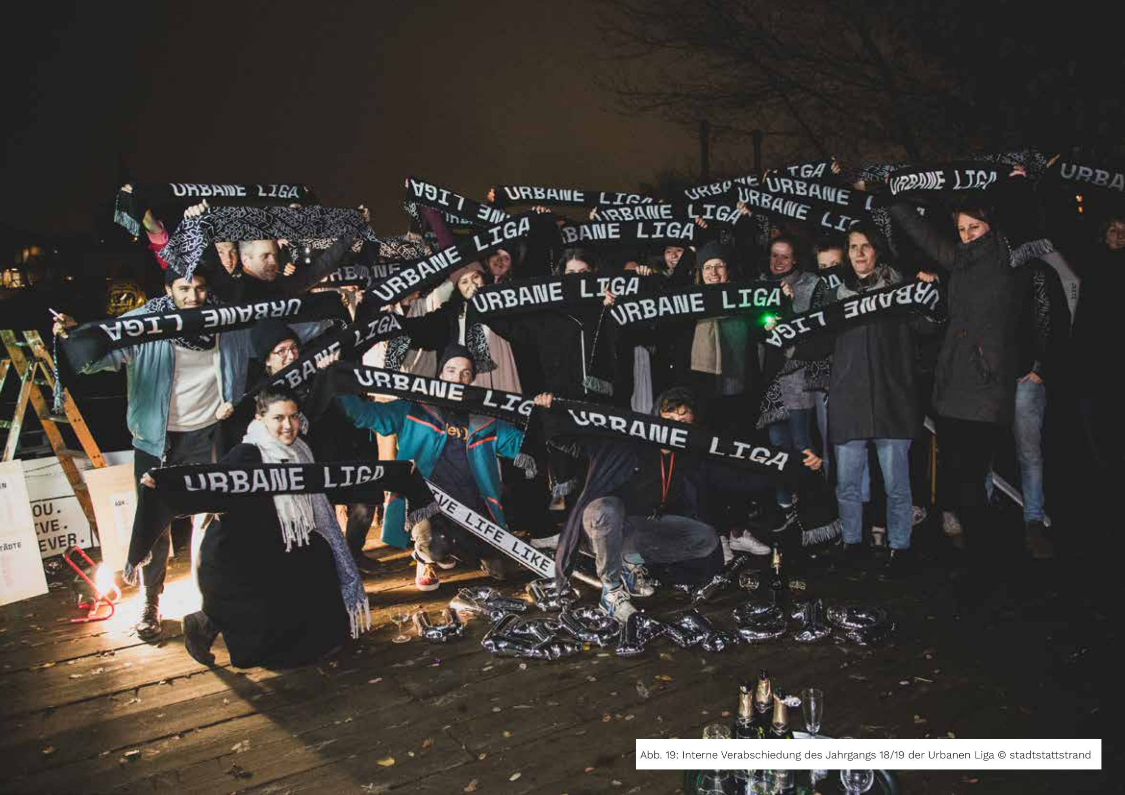
Abb. 19: Interne Verabschiedung des Jahrgangs 18/19 der Urbanen Liga