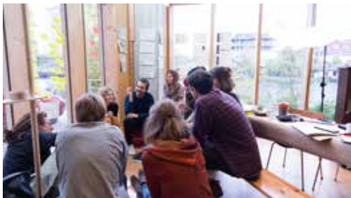
Abb. 11: Zukunftsschutzgebiete

Das vom Dresdner Konglomerat/ Rosenwerk in die Urbane Liga mit eingebrachte Thema der Zukunftsschutzgebiete wurde im Rahmen der Arbeitsphase gerschärft und in ein Kurzexposé übersetzt.