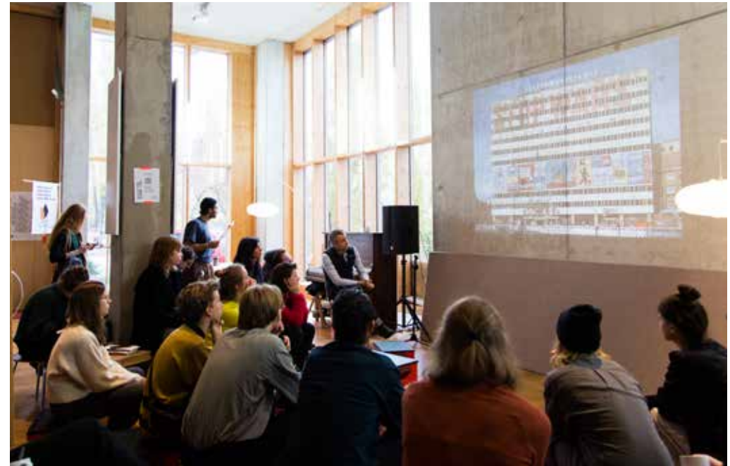
Abb. 5: Vortrag zum Baurecht

Auf Basis der von den „Jurbanisten“ in der Ko-Forschung der Urbanen Liga entwickelten Prozessgrafik für Stadtmacher-Projekte, skizzierten die Teilnehmenden den Entstehungs- und Genehmigungsprozess ihrer Projekte. Darauf aufbauend, arbeiteten sie auf weiteren Karten baurechtliche Hemmnisse bzw. angewandte Strategien heraus. Es entstand eine wertvolle Sammlung an Praxiswissen, die als Grundlage für den weiteren Prozess der Baurechtsgruppe im Hackathon diente. Zu den Erkenntnissen zählten folgende Punkte: Auflagen wie z.B. teure Statikgutachten, aufwendige Brandschutzmaßnahmen oder erhöhte Nachweispflichten bezüglich Lärmschutz können ein Projekt behindern. Durch die sorgsame Auswahl einer Fläche, wie zum Beispiel in einem Gewerbe- und Industriegebiet oder durch eine direkte Kooperation mit der Verwaltung können Genehmigungsprozesse vereinfacht werden.