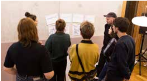
Abb. 10: Koop. Kodex

Diskussion und Fertigstellung des Entwurfs eines „Stadtmacher Codes“ der im zweiten Denklabor entstand und in einem weiteren Workshops und auf dem 13. Bundeskongress der Nationalen Stadtentwicklungspolitik im September 2019 reflektiert und kommentiert wurde.