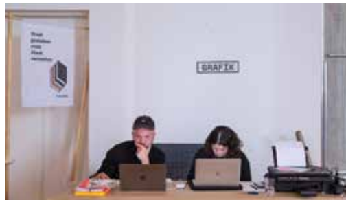
Abb. 13 Grafiker vor Ort

Ebenfalls vor Ort - um die Ergebnisse direkt für den Termin mit der Staatssekretärin aufzubereiten war das „Real-Time-Grafik Büro“ mit dem Team von any Studio.