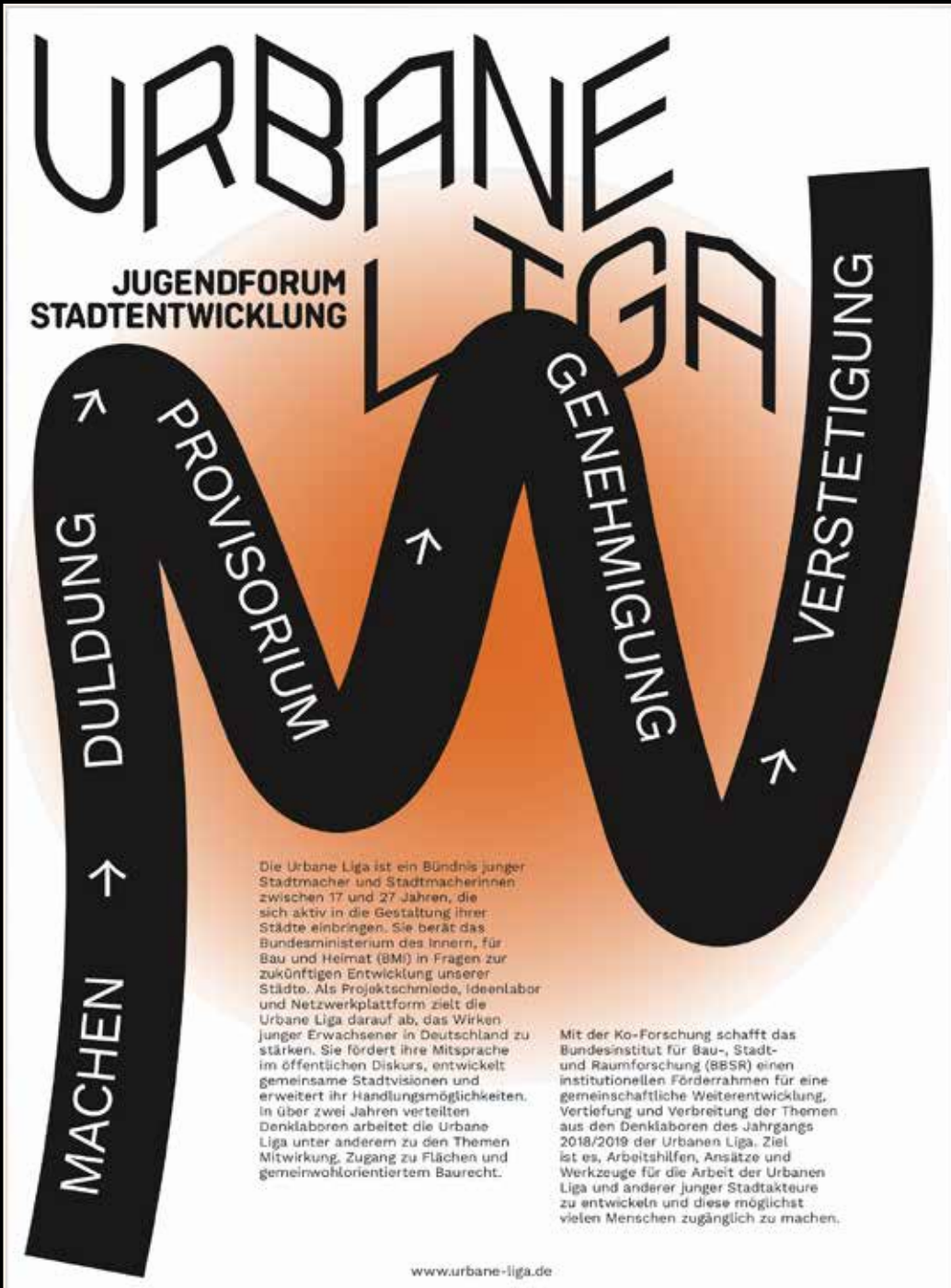
Abb. 15: Abbildung des Faltblatts "BauRECHT auf STADT machen", Vorderseite.