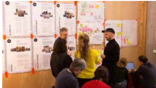
Abb. 12: Baurechtsgruppe © stadttatstrand

Die Ergebnisse aus dem Crowdsourcing aus Schritt 2 sowie der Arbeit der Baurechtsgruppe „Jurbanisten“ wurde in ein Faltblatt mit baurechtlichen Hemmnissen, Strategien und daraus resultierenden Lösungsansätzen übersetzt.