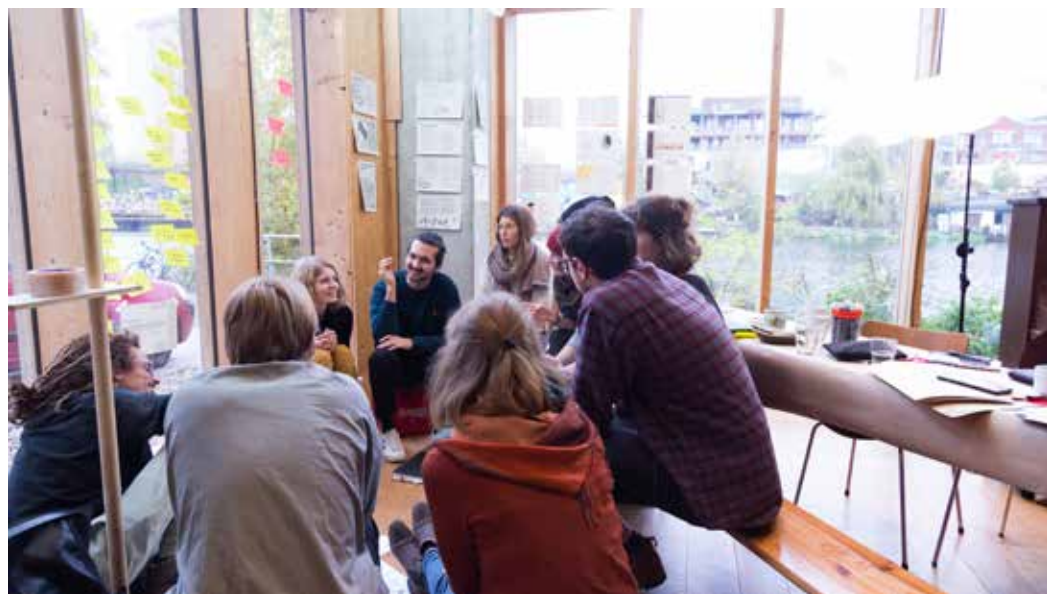
Abb. 1: Spreefeld Genossenschaft

Die Bau- und Wohngenossenschaft Spreefeld Berlin eG betrachtet es als ihre Aufgabe Wohnraum für generationsübergreifende, sozial gemischte, nachbarschaftliche Arbeits- und Wohnformen für ihre Mitglieder zu schaffen. Ein besonderes Detail im Nutzungskonzept sind mehrere Optionsräume innerhalb des gesamten Gebäudekomplexes. Diese werden auch lokalen Initiativen als Veranstaltungsräume zu günstigen Konditionen zur Verfügung gestellt. Entstanden ist das Quartier aus der Initiative "Mediaspree versenken", die sich gegen eine massive Nachverdichtung des Spreeufers mit Büro- und Hotelbauten zur Wehr gesetzt hat. Mit einem offen zugänglichen Grün- und Aussenraum und den freistehenden Wohnhäusern mit Gemeinschaftsterrassen wurde eine interessante Alternative zu den baulichen Entwicklungen „Mediaspree“ gefunden.