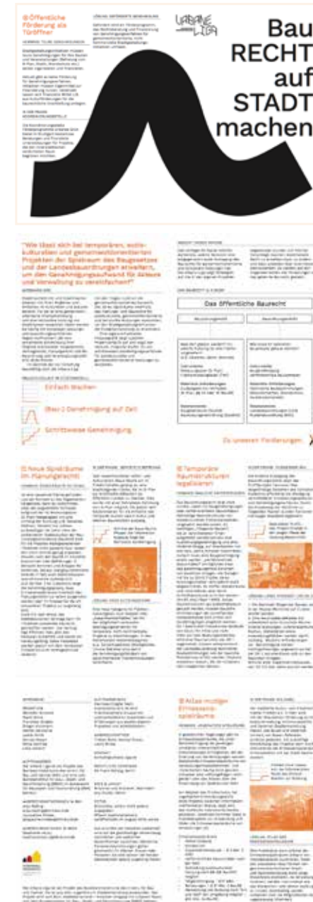
Abb. 16: Abbildungen des Faltblatts "BauRECHT auf STADT machen"

Im Rahmen des Hackathons wurden die Vorschläge von Grafikern in ein praktisches Faltplakat übersetzt, um es einem breiten Publikum zugänglich zu machen.