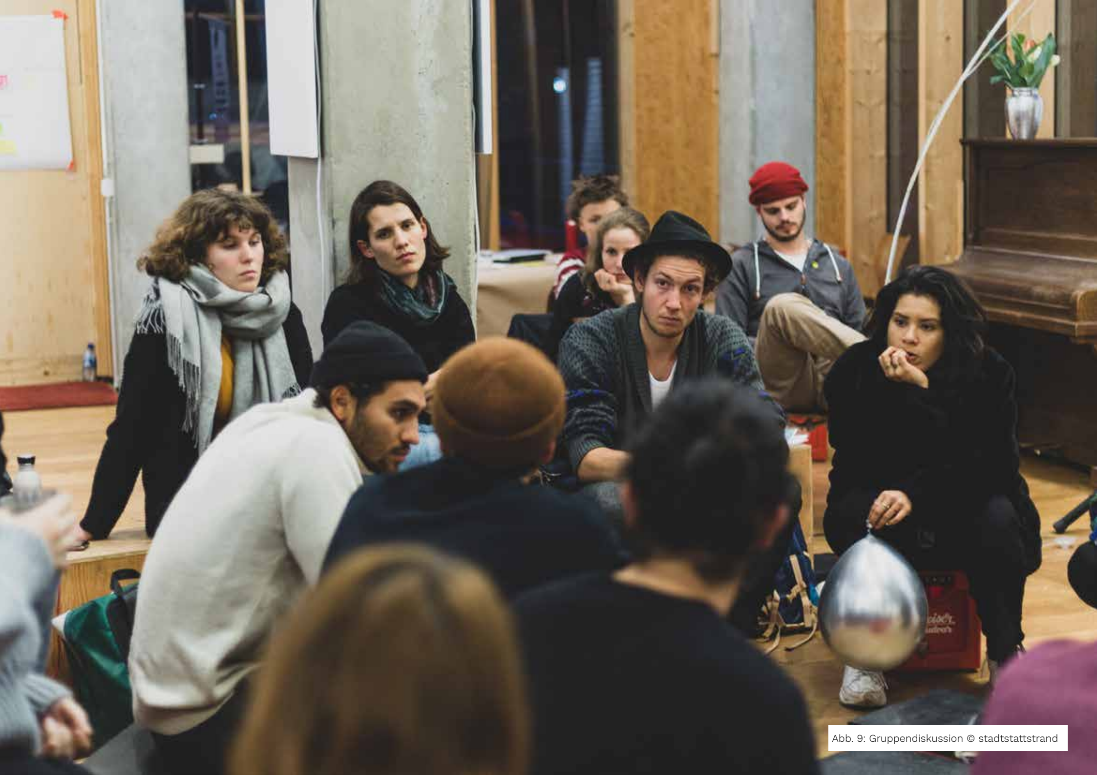
Abb. 9: Gruppendiskussion