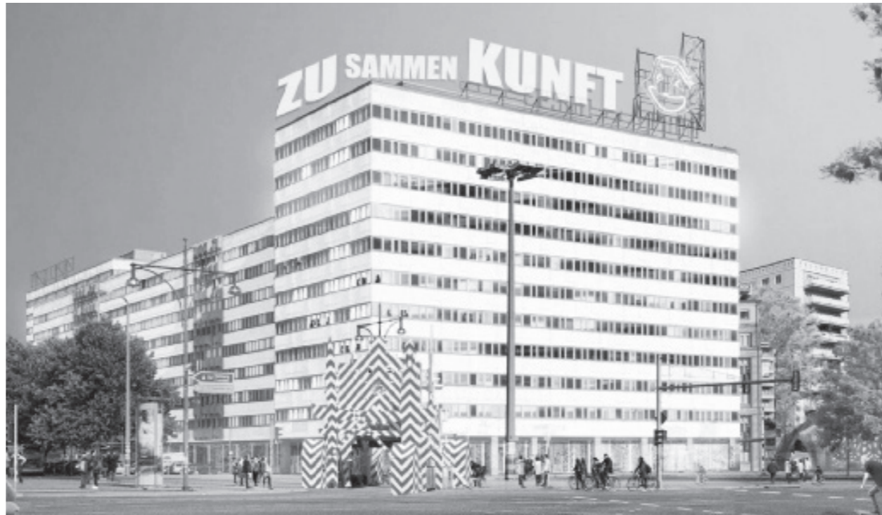
Verstetigungsphase #B-Plan #FNP #HausderStatistik