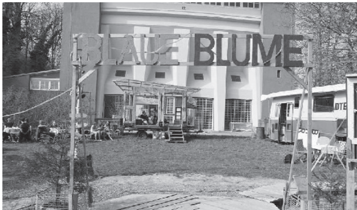
Phase d. rechtlichen Rahmens #Beschleunigtes und Vereinfachtes Verfahren #Finanzielle Erleichterung #BlaueBlume