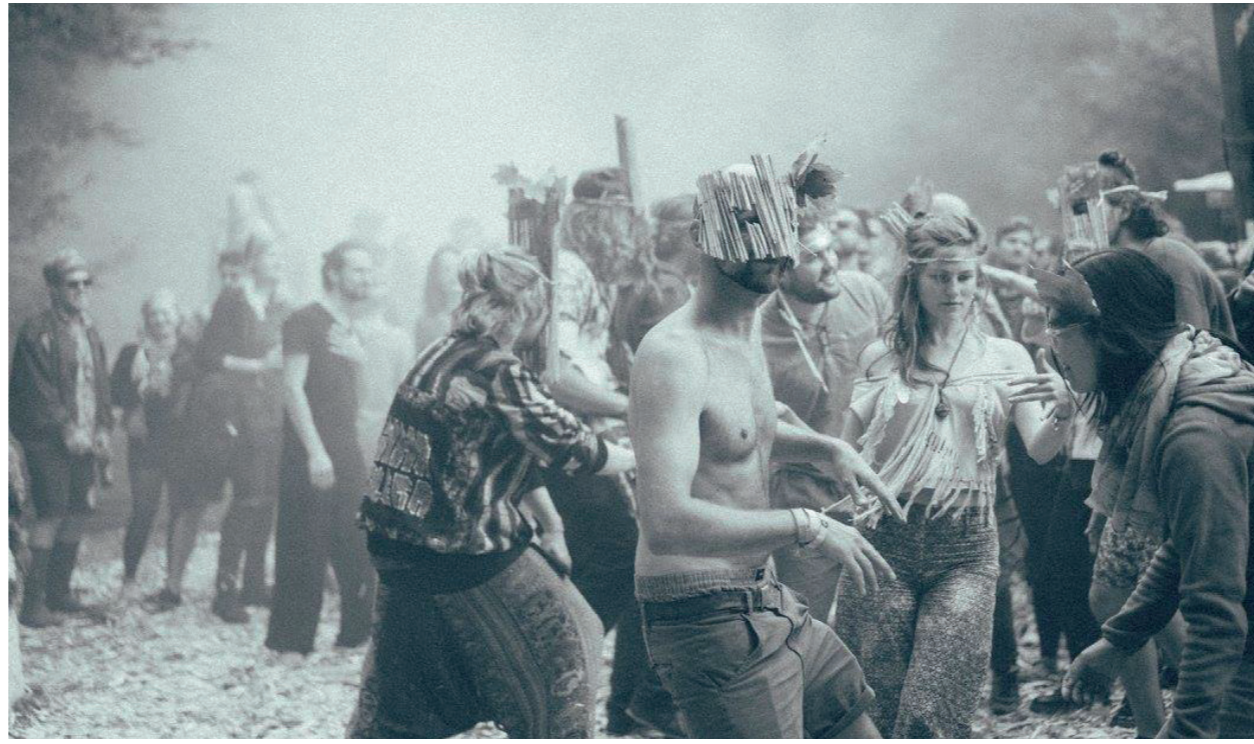
Einfachmachen Phase #Idee #Einfachmachen #MinhaGalera