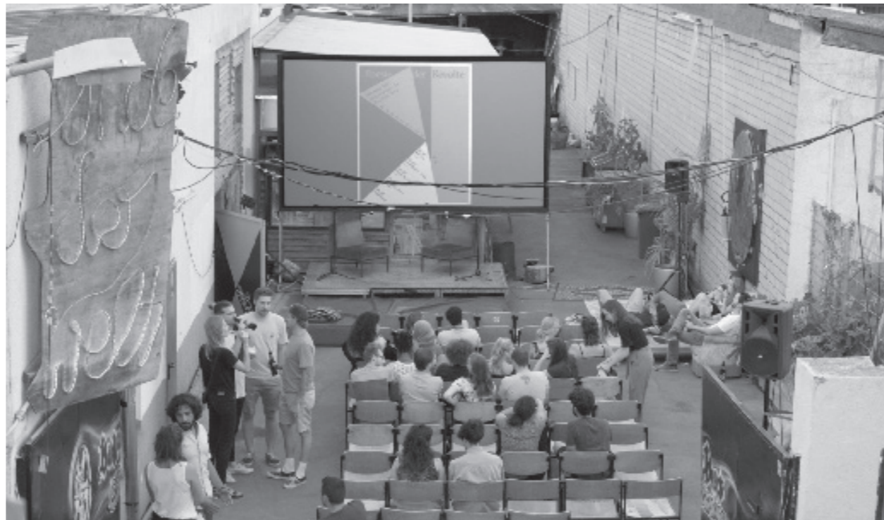
Duldungsphase #Scheuklappen #Ermöglichungskultur #Passive Duldung #NiehlerFreiheit