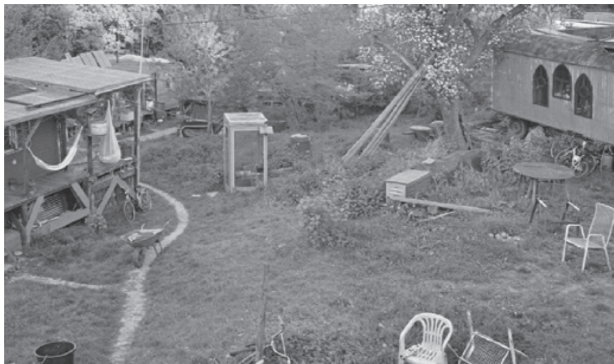
Kooperationsphase #Baurecht auf Zeit # §9 II , §34a BauGB #Experementier Klausel #BambuleTübigen